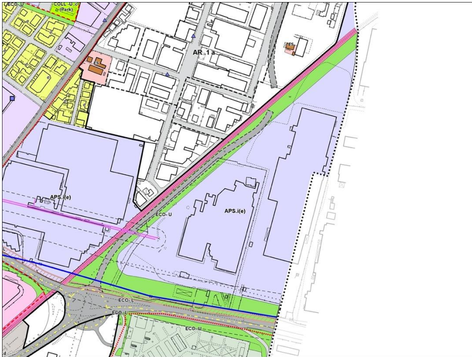
Estratto RUE del Comune di Sassuolo – Vigente