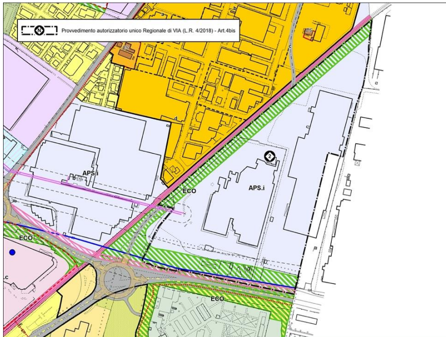
Estratto PSC del Comune di Sassuolo - Variante