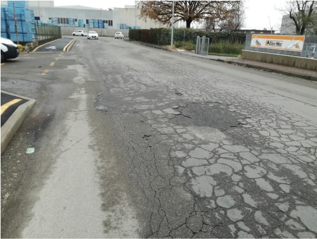
Via Aldo Moro