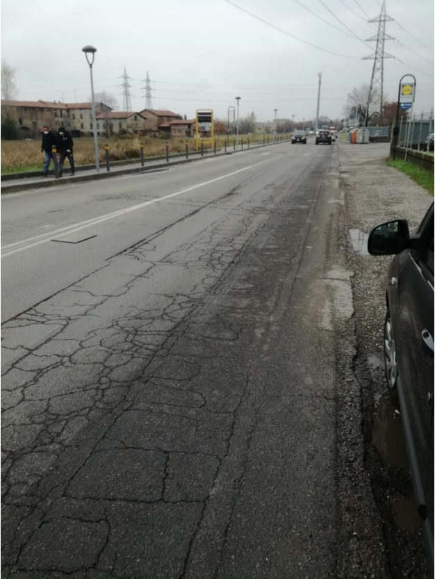
Via Vittime 11 Settembre