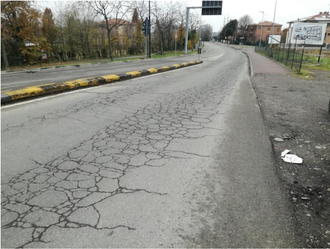
Via Vittime 11 Settembre