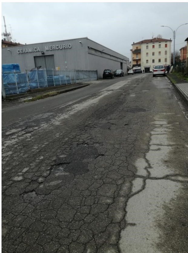
Via Aldo Moro