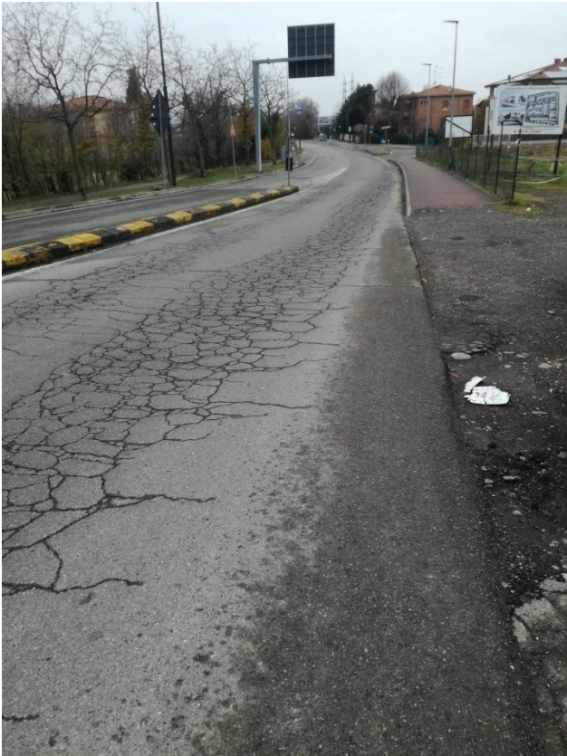
Via Vittime 11 Settembre